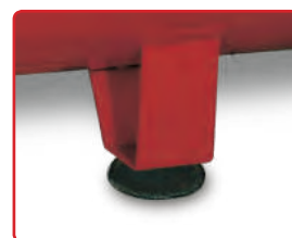
3 Piedi fissi con antivibranti.