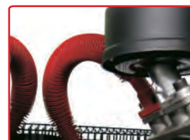
1 Collettore finale in acciaio alettato.