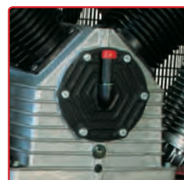
2 Carter portacuscinetto in ghisa per lunghissima durata.