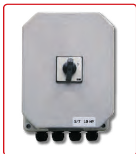
Avviatore stella/triangolo compresso.